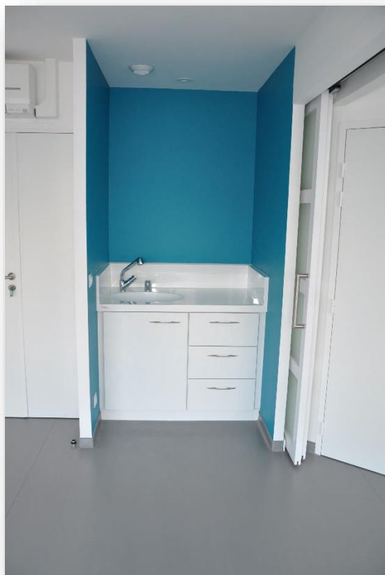
TABLE À LANGER RÉSINOR

Plateau « sur mesure » en résine sur un meuble en stratifié.